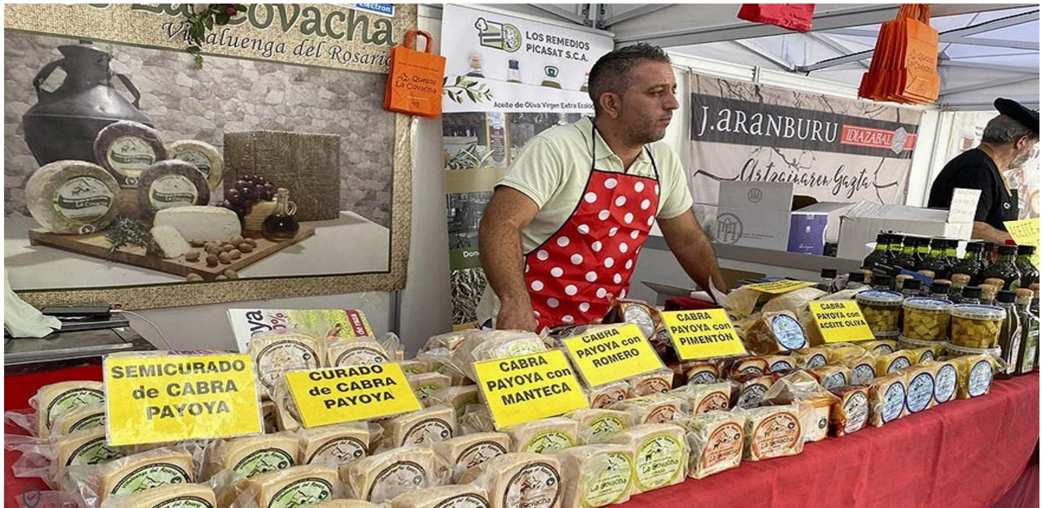
Variedades de queso expuestas en las calles de Zamora.

Al mismo tiempo, destacó que Fromago es una herramienta fundamental para el sector quesero de la provincia de Zamora que exporta sus productos a los mercados exigentes de 25 países y que tiene todavía un margen de crecimiento que también repercutirá en la economía zamorana.