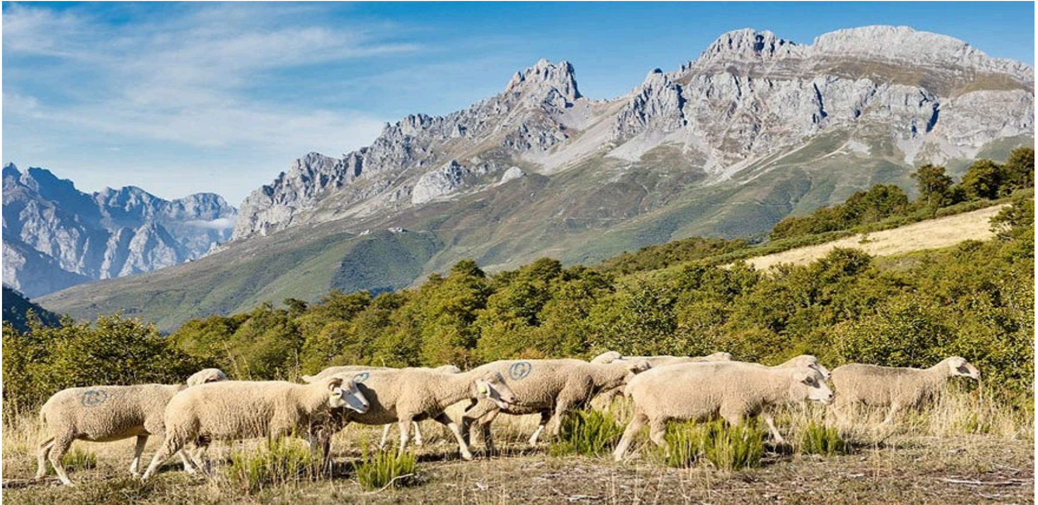
Rebaño ovino extensivo.

La iniciativa Previnovic surge en un contexto de cambio climático, con el aumento de las temperaturas y la escasez de lluvias acentuando los periodos de sequía. Los ecosistemas mediterráneos son particularmente vulnerables a estas condiciones, aumentando el riesgo de incendios forestales incluso fuera de los periodos habituales.