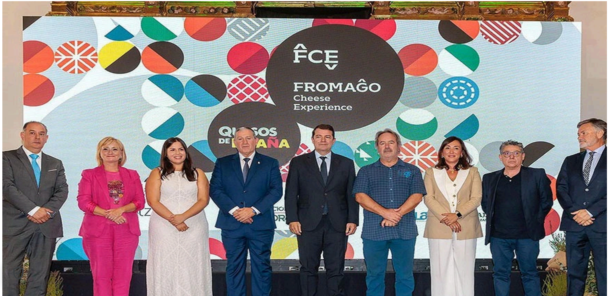
Foto de familia del acto de inauguración.

También se desarrolla el concurso en el que se elige al Mejor Fromelir de España, como experto en este producto encargado de recomendar las distintas variedades en un restaurante y otro de elaboración de la Mejor Tabla de Quesos.