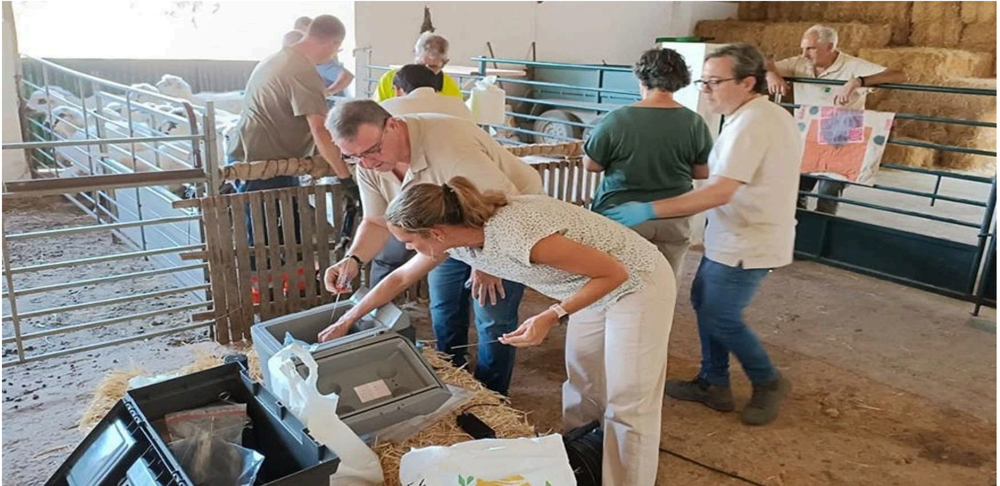
Inseminación de hembras de la raza Churra Lebrijana.

El objetivo es obtener las primeras hembras cruzadas al 50%, para, en una fase posterior, continuar con la reproducción utilizando machos puros de Churra Lebrijana, repitiendo este ciclo con las hembras descendientes. Todos los animales serán sometidos a un análisis de adscripción a la raza, hasta lograr el porcentaje necesario para que cumplan con las características y pureza de la Churra Lebrijana.