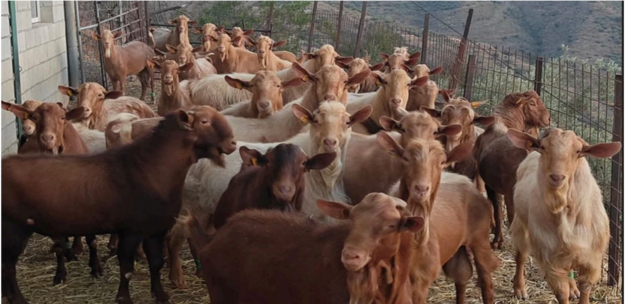
Explotación de la raza caprina Malagueña.

“Tanto es así que los ganaderos se ven obligados a comprar cubas de agua, y esto es inviable. Necesitamos con urgencia soluciones para ya, y de cara al futuro, por lo que reclamamos a la Junta de Andalucía un plan estratégico de abastecimiento de agua para las explotaciones ganaderas, para que esto no vuelva a ocurrir”, explica el responsable de COAG Málaga.