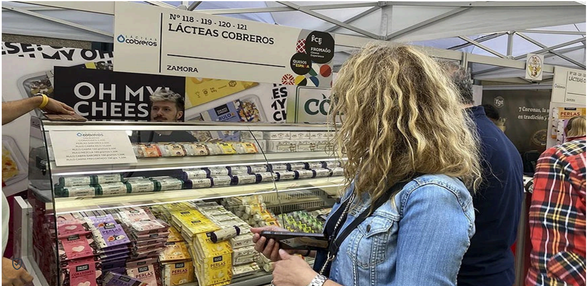
Punto de venta de Lácteas Cobreros en Fromago Cheese Experience 2024.