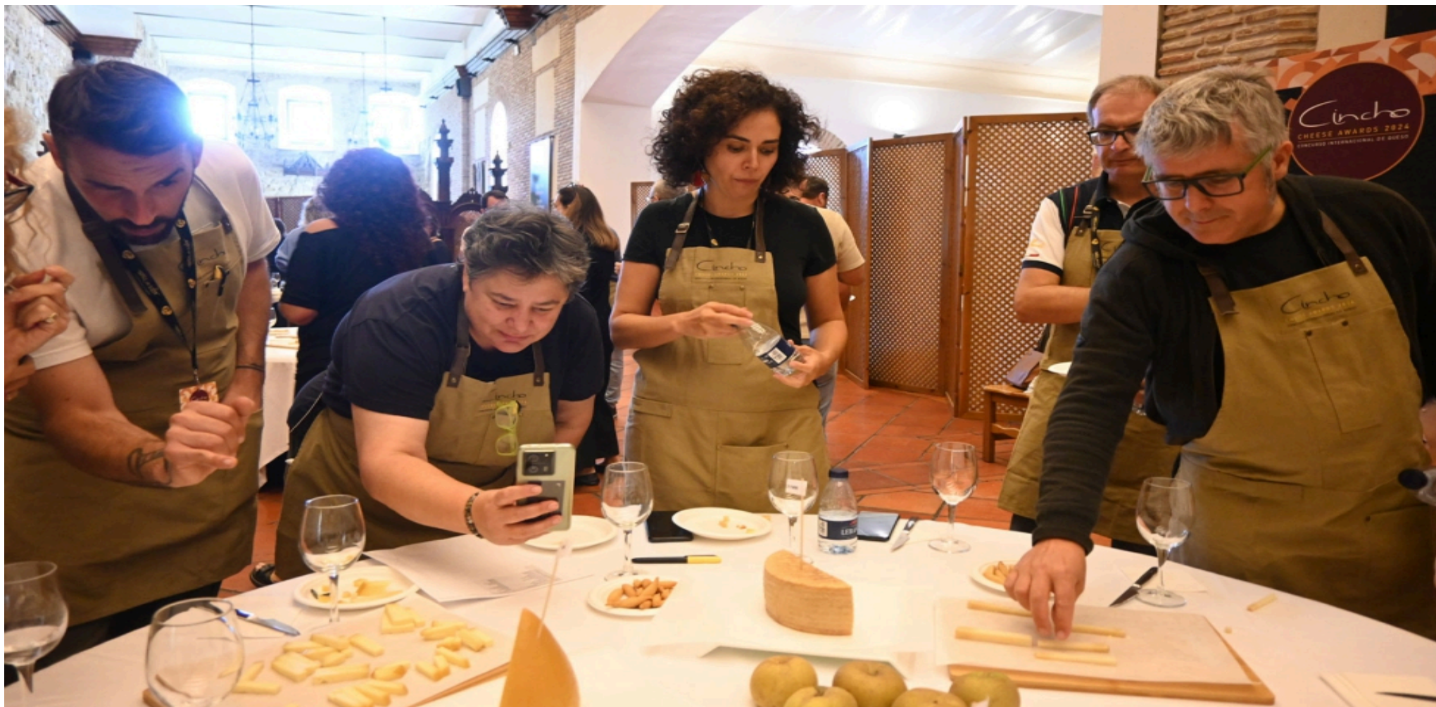
Cata de quesos en los Premios Cincho.

a Jaspe, de LAVEGA ECO, producido en Moslares de la Vega, Palencia.